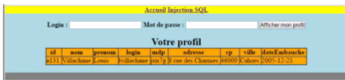
Figure 3: Retour du formulaire après saisie et soumission