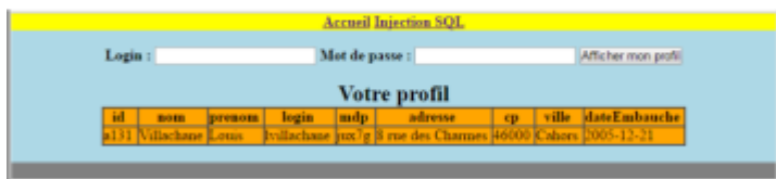
Figure 3: Retour du formulaire après saisie et soumission