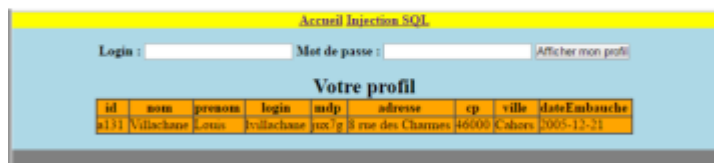
Figure 3: Retour du formulaire après saisie et soumission