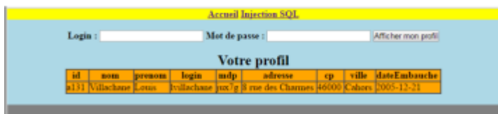
Figure 3: Retour du formulaire après saisie et soumission