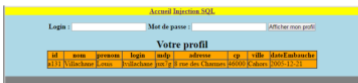
Figure 3: Retour du formulaire après saisie et soumission