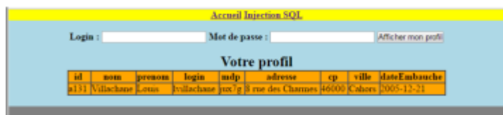
Figure 3: Retour du formulaire après saisie et soumission