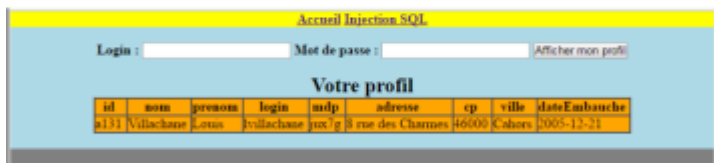
Figure 3: Retour du formulaire après saisie et soumission